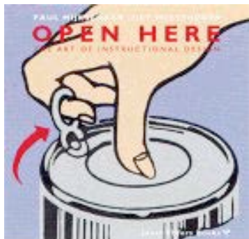
Figure 1. Exemple d'image insérée dans la marge de l'article.